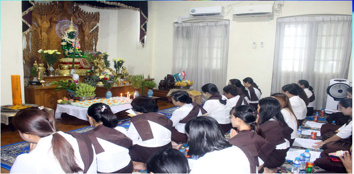
အကောက်ခွန်ဦးစီးဌာန၊ ဓမ္မစကြာဝတ်ရွတ်အသင်းမှ ဝါတွင်းကာလ ဓမ္မစကြာနှင့် ပဋ္ဌာန်းဒေသနာတော် တို့အား ရွတ်ဖတ်ပူဇော်စဉ်။

အကောက်ခွန်ဦးစီးဌာနမှ ဝါတွင်းကာလအတွင်း ဓမ္မစကြာ၊ ပဋ္ဌာန်းဒေသနာတော်တို့အား ရွတ်ဖတ်ပူဇော်နိုင်ရေးအတွက် အဖွဲ့တစ်ဖွဲ့တွင် ဝန်ထမ်းအင်အား (၃၀) ဦးခန့်ဖြင့် အဖွဲ့(၂) ဖွဲ့ခွဲ၍ ရွတ်ဖတ်ပူဇော်ပြီး အဖွဲ့တစ်ဖွဲ့လျှင် လက်ထောက်ညွှန်ကြားရေးမှူး (၂) ဦးမှ ဦးဆောင်၍ လပြည့် ၊ လကွယ်နေ့များ၌ ရွတ်ဖတ်ပူဇော်လျက်ရှိပါသည်။ ဓမ္မစကြာ ၊ ပဋ္ဌာန်းဒေသနာတော်များ ရွတ်ဖတ်ပူဇော်ခြင်းအား ၂-၁၀-၂၀၂၄ ရက်နှင့် ၁၅-၁၀-၂၀၂၄ ရက်များတွင် ရွတ်ဖတ်ပူဇော်ခဲ့ပြီးဖြစ်ပါသည်။